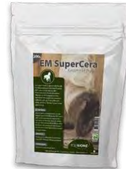
EM Super Cera

EM® SuperCera är ett keramiskt pulver baserat på en japansk lera som fermenterats med Effektiva Mikroorganismer. När keramiken blandas med flytande EM® blir det till en lera som gör att effekten av mikroorganismerna förstärks vilket kan förhindra röta och oxidation. Leran bildar ett skydd mot bakterier och möjliggör läkning av hovar och sår.