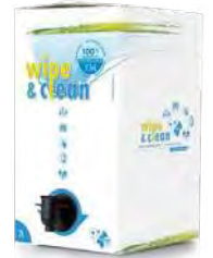
Wipe & Clean finns i 2l och 20l