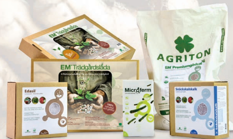
EM Trädgårdslådan - allt du behöver för din trädgård, och odling under en säsong.

Blanda ut Microferm med vatten (1: 100), dvs 1DL till 10L vatten innan användning.